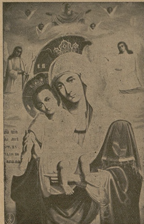
Изображеніе Аеонской Божіей Матери, именуемой „Достойно есть“.

Икону эту со Святой Горы Аеонской привезъ Его Блаженство, Блаженнѣйшій Митрополитъ Діонисій, въ Варшаву 21 іюня. Въ воскресенье, 20 іюля, около 9 часовъ утра, Святая Икона съ благословенія