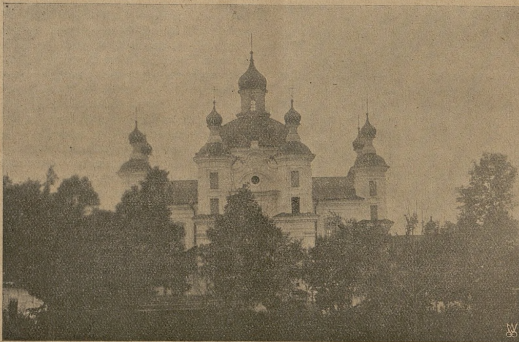
Св. Покровскій храмъ въ с. Поддубцахъ, Луцкаго уѣзда, на Волыни.