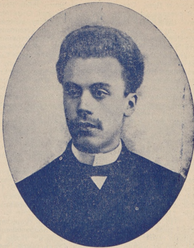
Блаженнѣйшій Митрополитъ Діонисій,

Христосъ въ нихъ столь полонъ, обилентъ и живъ, что они изъ свидѣтелей превращаются въ доказательство. Св. Кипріанъ пишетъ: „Мученики не дѣлаютъ Евангелія, но Евангеліе создаетъ ихъ“. Не буква Евангелія, но его духъ, его благодать, его освященіе. Мученики — нѣчто столь совершенное, что только Богъ могъ ихъ создать. Они свидѣлствуютъ объ истинѣ чудесами, но они уже сами по себѣ — величайшее чудо. Ихъ добродѣтель, почти нечеловѣческая, также чудесна. Всѣ добродѣтели — вѣра, надежда, любовь къ Богу и ближнимъ, терпѣніе, кротость, смиреніе доведены въ нихъ до совершенства, проявляются въ нихъ въ такой чистотѣ и красотѣ, что почти не вѣришь, что это подобныя намъ существа. Если намъ трудно достигнуть ихъ совершенства и величія, то