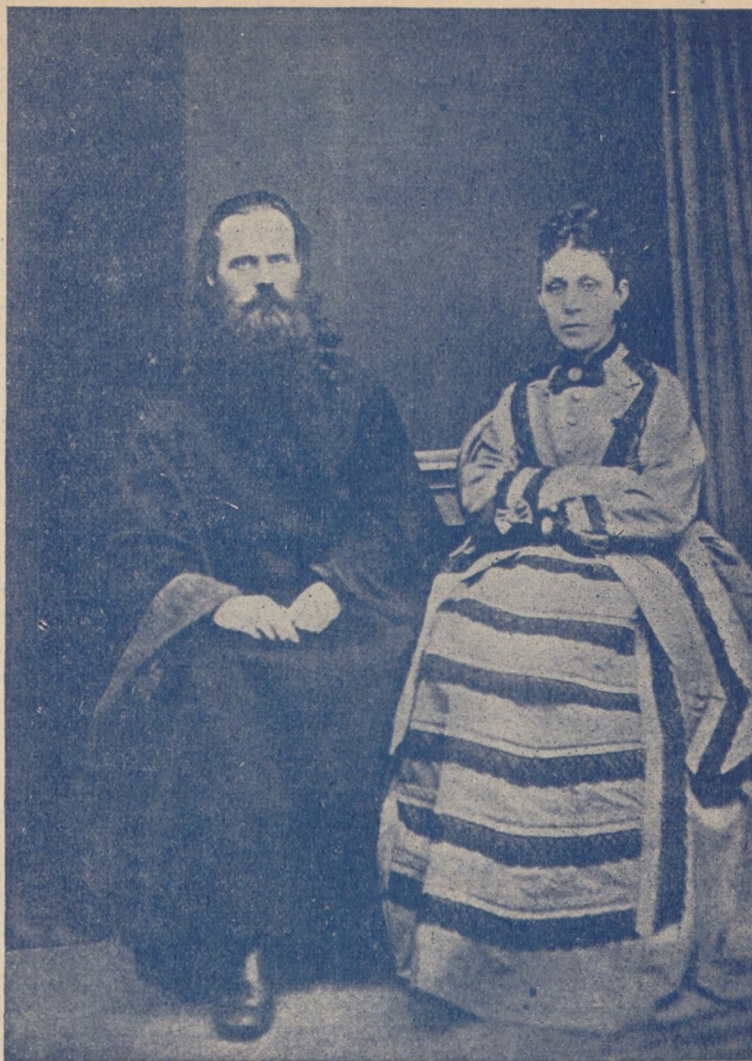
Родители Блаженнѣйшаго Митрополита Діонисія:

Христосъ Самъ открылъ именно эту цѣль Своего воплощенія въ словахъ Пилату: „Я на то родился и на то пришелъ въ міръ, чтобы свидѣлствовать объ истинѣ“ (Іоан. 18, 37). И настала часъ, когда Христосъ обратился къ Отцу Своему со слѣдующими словами: „Я прославилъ Тебя на землѣ, совершилъ дѣло, которое Ты поручилъ