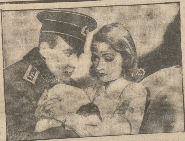
Constance Bennet w filmie „Ostatni alarm“ wkrótce w kinie „Femina“.

Słowo odgrywa w filmie rolę drugorzędną i powinno służyć li tylko do pełnienia objaśniającego. Film stworzono nie po to, by go „rozumieć“, jest on poprostu rozrywką, notabene nie wymagającą od widza żadnego „wysiłku umysłowego“. Valery przyznaje, że kino ma cudowną zdolność porwania milionów ludzi wszystkich ras i narodów i pod tym względem jest bezkonkurencyjne.