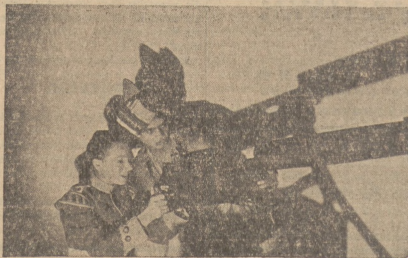
Scena z filmu kolorowego „The Drum“, reż. Al. Kordy.

Wykonano do niej 2 miliony rysunków, z czego uzyskano 250.000 klatek filmowych, zrobionych dokładnie na tle muzyki. Nad wykonaniem filmu pracowało 600 malarzy i 187 kobiet, które przenosiły wykonane rysunki na przezroczyste arkusze celuloidowe. Praca przy filmie trwała z górą trzy lata.