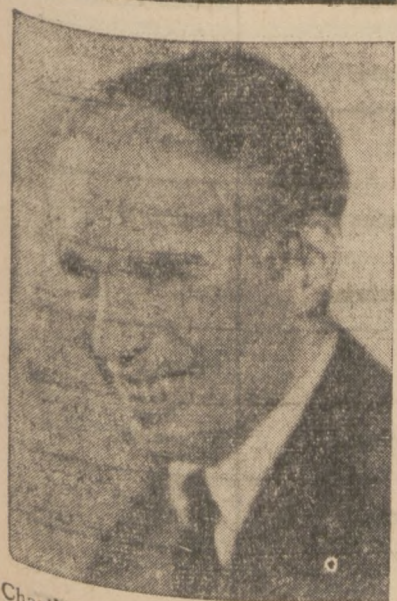
Charlie Chaplin przystępuje do realizacji pierwszego w swym życiu dźwiękowca.

Nie jestem poinformowany kto dokonywał wyboru filmów, mających być przedstawionymi dla prasy. Nie jestem poinformowany również o tym w ogóle, kto decyduje o doborze tematów dla wsi polskiej. A to jest przecież najważniejsze. Bo pocóż mamy sobie oczy wydląć? Poco PAT urządza konferencję prasową, na którą zaprasza dziennikarzy stołecznych? Nie po to chyba, żeby zaznałamić z ilością sprzedanych aparatów, jakością ich, przeproszę zaletami, marką i drobiazgamami technicznymi. Wąska taśma nie jest przecież „tabula rasa”. Nie jest ona odkryciem PAT'a.