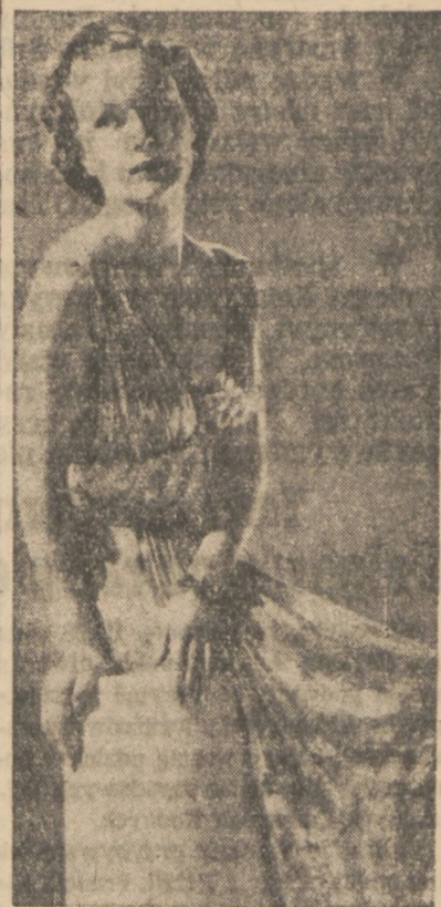
Posagowo piękna Sigrid Gurie wyłowiona przez Sama Goldwyna w czasie jego podróży po Europie odniosła sukces w filmie „Przygody Marco Polo” jako partnerka Gary Coopera.