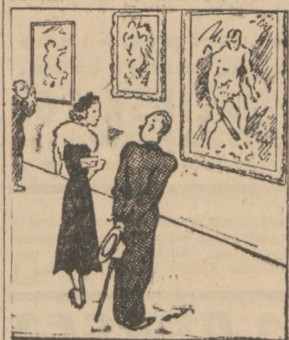
— Czy chciała pani już kiedyś zostać mężczyzną? — Nie, a pan?

W ciągu pozostałych dni, żona uważa się za zupełnie zależną kobietę i może robić wszystko, co się jej tylko podoba.