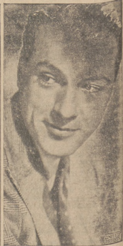
Garry Cooper, wysoki chłopiec z Montany jest dziś najpopularniejszym aktorem filmowym. Najbliższym jego filmem jaki ukaże się w Polsce będą „Przody Marco Polo”

Dużo się mówi w Londynie o nowym wybruku „wielkiego kpiarza” — Shawa, który zaproponował Shirleyce odegranie roli Kleopatry w nowym filmie pg. Shawa „Cezar i Kleopatra”.