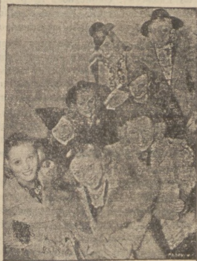
Gromadka młodych „gwiazd” udaje się na zdjęcia.