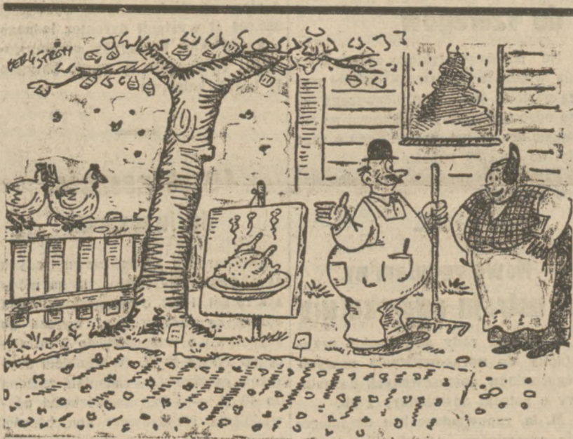
— Ten obraz umieściłem, aby się kury przelekły. Może przestaną zanieczyszczać werandę.