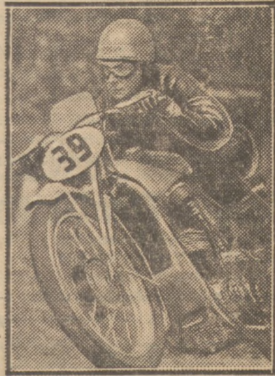
Zwycięzca w kategorii do 350 cm 3 Wunsche po wyjściu z lasku Bielańskiego wpada na szosę. Fot. na błonach „Kodaka”

Zawodnicy wystartowali we wszystkich kategoriach w odstępach mi-