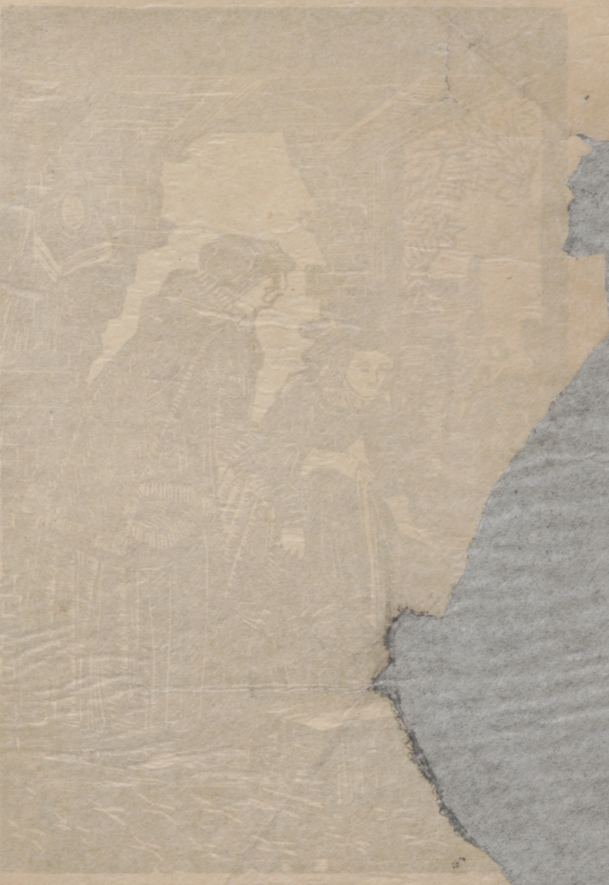
Am 5ten Vorstellung Gewöhnliches Programm