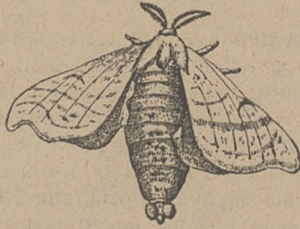
Самичка мотіля шовковика

Прядун шовковик (прядка шовкова, Bombyx mori ), це мотиль, що належить до родини прядунів. Кождий мотиль складає яечка. З яечка вилягається гусениця, яка протягом 5—6 тижнів виростає й перемінюється в личинку, куклу, з якої виходить мотиль. Те саме діється і з прядуном шовковиком.