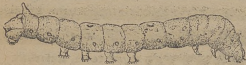
Гусениця шовковика у всіх періодах свого життя.

Сідала ті робимо зі сухих галузок дерев, або твердих роетин, які втикаємо одну коло другої в рами полиці, на яких плекаються гусениці. Найкраще надаються до того галузки берези, дуба й густі галузки ріжних корчів. Галузки не можуть бути з колочками та не сміють бути із роетин, які видають сильний запах.