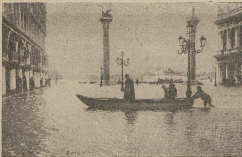
Італійське місто Венеція, одиноке в світі є побудоване на морі так, що води Адріатики пливають його вулицями. Весь рух у місті відбувається майже виключно при помочі човнів-лодок яких там є безліч. В часі вітрів та бурі на морю монські філі заливують навіть висше положені часті міста. На образку бачимо площу св. Марка залиту морем. При площі тій стоїть славна на весь світ церква св. Марка. Так у Венеції навіть на тих скупих місцях, де за погоди мож станути сухою ногою — в часі бурі треба вживати човнів.

І служи річам вічним і для других. Помагай, що в твоїй силі, щоб земля поволи перемінювалася в ниву, в квітник Божий, щоб не ставав до боротьби ніхто, кого ти не навчив побіджати, щоб ніхто не терпів, кому ти не вказав, як перемогти терпіння, щоб ніхто не впав, кому ти не помігби встати! Щоб нікому ти не відмовив помочі, коли можеш, на його прохання, щоб нікого не лишив ти без поучення, коли він недоброго бажає! Помагай, що в твоїй силі, щоб очі ясніше сяли, щоб серця стали чистіші, руки пильніші, ноги певніші на дорозі до доброго. Щоб слези висихали, або щоб їх сплакували в Божі руки! Щоб проклони лихого відбивалися безслідно від стін благословенства, що ти помагаєш будувати їх. Помагай, кілька можеш, щоб Бог став людям батьківщиною, щоб усі пізнали Його, що досі тільки викривлене лице Його малюють собі, а й те потім опльовують! А де тебе за помічню доброту винагороджують глумливою злобою, там будь більший, як усі, що не хочуть знати тебе — молися, перемагай, прощай!