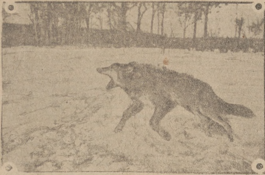
Мороз та сніги вигнали з недоступних карпатських дебр хижу звірину, диків та вовків, які шукаючи за поживою, непокоїть підгірські оселі та спричиняють шкоди. На нашому образку бачимо вовка-сіроманця, який, на нашім Підкарпатті, задалеко загнався під людські оселі та згинув від кулі.