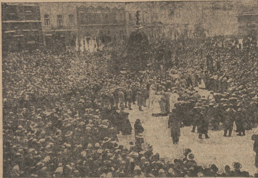
Знімка зі сегорічного Йорданського торжества на Ринку у Львові.