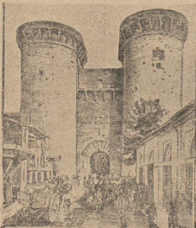
Валенція. прегарна столиця давнього королівства тоїж назви стала сьогодні осередком революційного руху проти диктатора Прімо де Рівери. В місті тім є много цінних пам'яток із часів панування Маврів та середньовіччя. На образку бачимо західну браму укріпленого колись оборонними мурами міста.