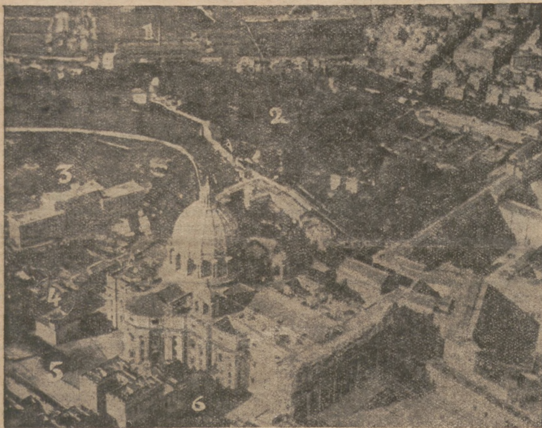
На знімці бачимо вид папської держави з лету літака.