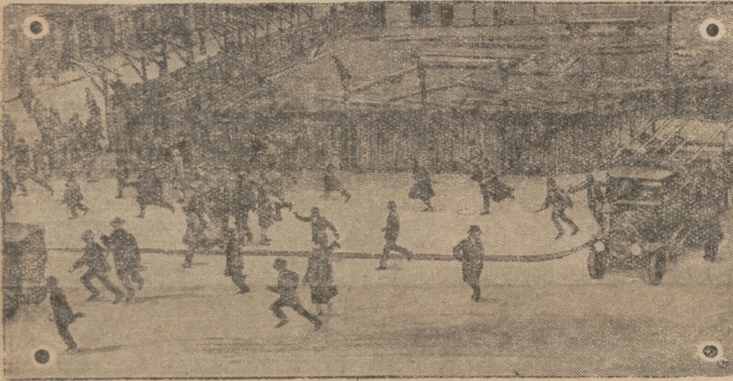
Знімка представляє берлінську поліцію в хвиль, коли проганяє ватаги нападаючих на неї комуністів на одному з передмість Берліна.