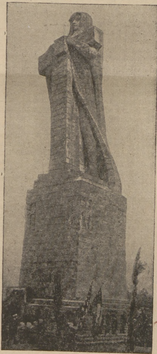
На побережжю Іспанії збудовано недавно великий пам'ятник Христофа Колумба, який перший відкрив був Америку. На знімці бачимо цей пам'ятник.