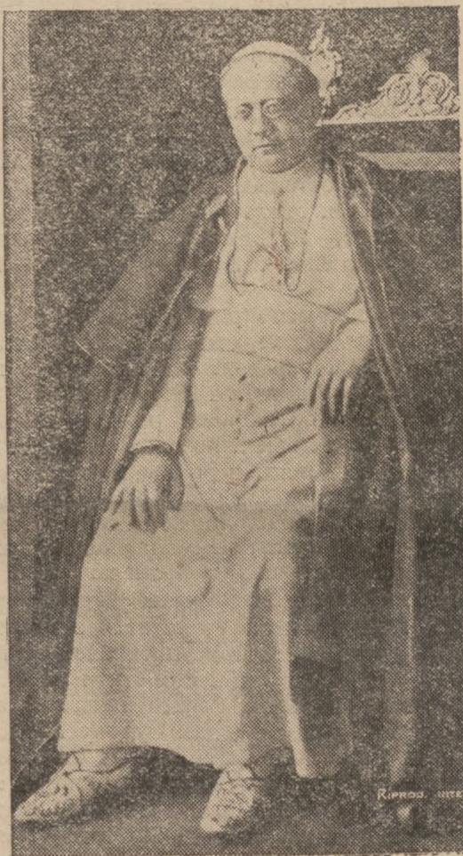
ПАПА ПІЙ XI.

1914 р. кілька днів перед вибухом війни був покликаний на наслідника о. Егрле до Ватиканської Бібліотеки в Римі.