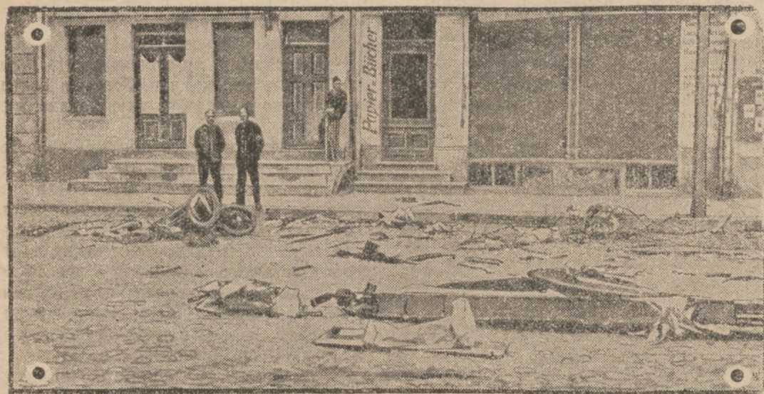
В Німеччині, в місцевості Штум, в часі посвячування пам'ятника поляглим летунам скоїлася страшна летунська катастрофа. В однім літаку відірвалися під час лету оба крила й він упав на місцевий ринок. Летун згинув, а з літака остали лиш тріски, як се бачимо на повисший знімці.

Всі ті заняття жидів були для них дуже корисні. Вони багатіли, але за те пише він у згаданій вже вище книжці на стор. 33: