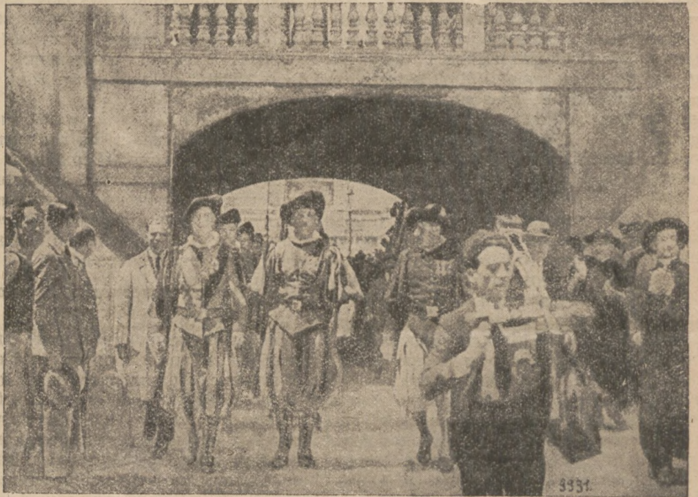
По підписанню договору між Італією й Апостольською Столицею швайцарська сторожа ватиканська перебрала службу від італійських „карабінерів“. Знімка представляє згадану зміну сторожі.