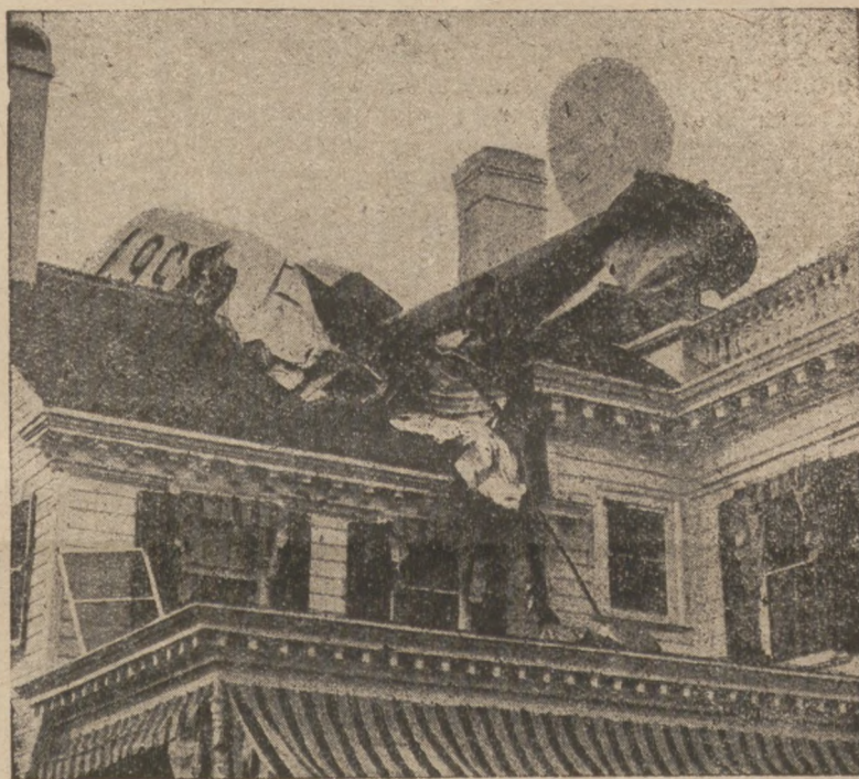
На дах дому губернатора міста Нью Ерсей впав літак. Пробивши дах і стелю — попав до спальні губернатора. Не знати, чи радий був губернатор такому гостеві.