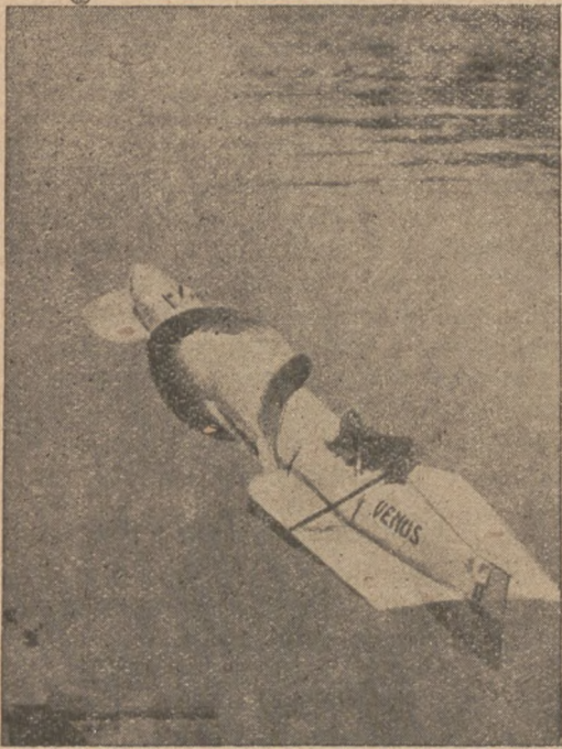
Один французський інженїр збудував моторове човно, яким сподїється він у 30-ти годинах переплисти Атлантийський океан. На знімці бачимо отсе човно.