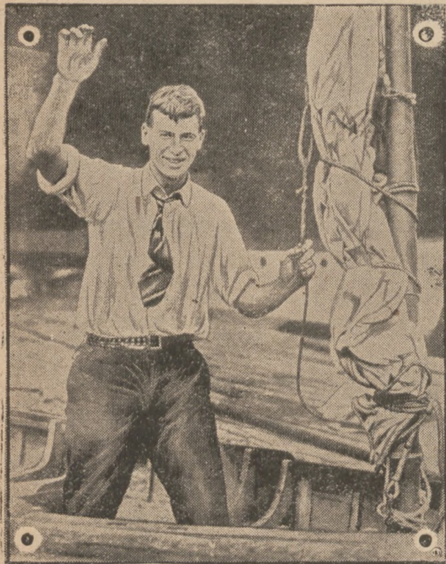
Моторовою лодкою через Атлантийський Океан

гони повні прогульковців. В околиці Берліна і Бремен, головнож біля Гамбурга, були в неділю електричні бурі з вихром. Великі шкоди заподіяли бурі в північній Шлезвіку. Підчас бурі потонуло 4 людей в альтонському озері. Від громів згоріло кілька великих господарств. На острові Ругії грім ударив у шопу й запалив її. Згоріло 500 овець. Над Надренією перейшов хмаролім із грозами. У Дюрем упав великий град і повибивав шиби в домах. Через 20 хвиль град так бомбардував місто, що люди не могли показатися на вулиці. В Агердамі грім убив двоє людей.