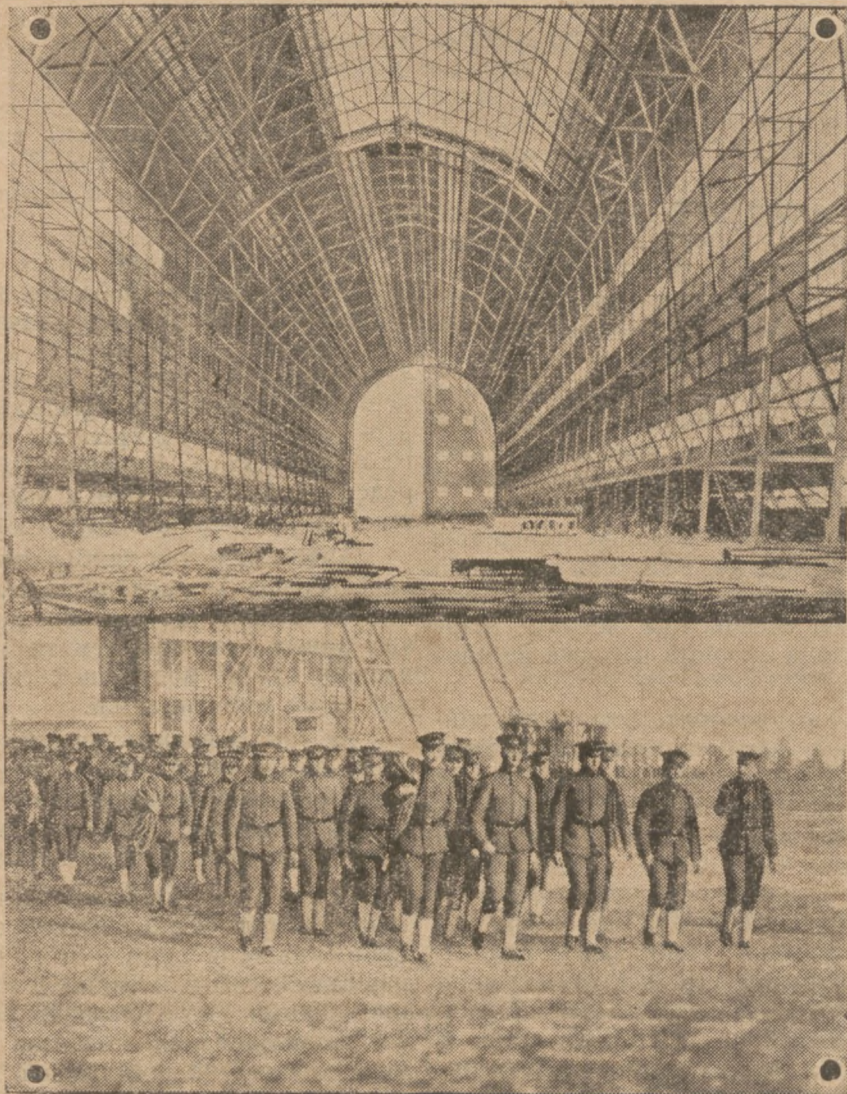
З побуту „Цепеліна“ в Англії. Величезний летунський гангар (шоп) в Лекгурсет, де відпочивав „Цепелін“ підчас своєї подорожі. На знімку в доді, бачимо відділ англійської летунської служби, який спішить помагати „Цепелінові“ в причалуванні.