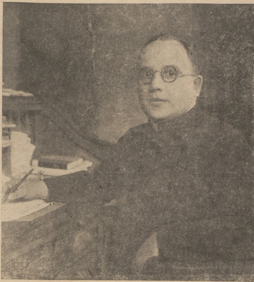
Впр. о. Др. Іван Бучко.

Сими днями Апостольська Столиця іменувала Впр. о. д-ра Івана Бучка львівським Єпископом-Помічником (суфраганом). Місце Єпископа-Помічника у львівській А.-Епархії було необсаджене від смерті бл. п. Єпископа Йосифа Боцяна, то є від осені 1926 р. Новоіменований Владика син селянина, дяка в Германові к. Львова, уродився 1. X. 1891 р. Богословські науки скінчив у Римі, де одержав науковий степєнь доктора. Там також був висвячений на священника в 1915 році. Від 1920 р. став професором св. Богословія у львівській Духовній Семинарії, а крім того від 1919 р. є ректором Малої Семинарії у Львові т. зв. Інституту св. Йосафата.