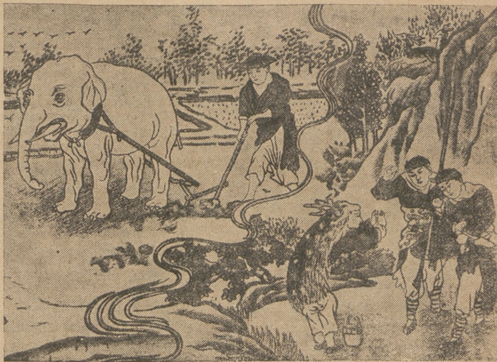
Старинний китайський образ: Управа рілі в давнину в Полудн. Китаю. Тип „білого“ Китайця, що оре сломом.

Китай, се найбільша держава на світі, бо обіймає простір 10 мільйонів кв. км., себто 20 разів більший від України й має 430 мільйонів населення. Нині ся великанська держава потапає в огні домашньої війни й безнастанних бунтів і повстань генералів, що свій край довели до страшної руїни й упадку.