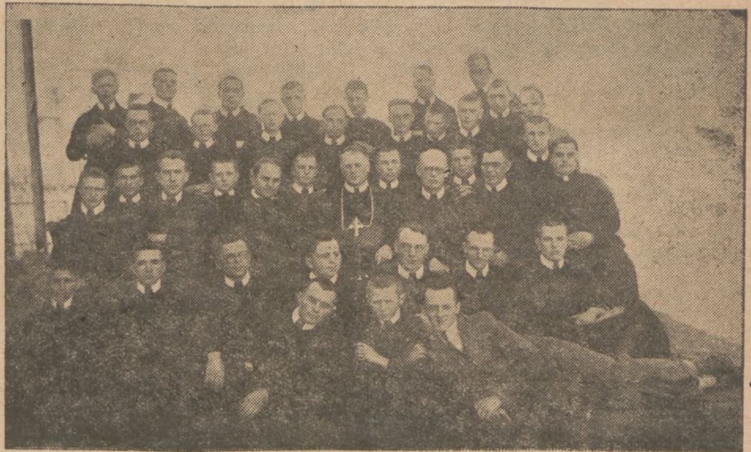
Канадійський Єпископ Влреосв. Василь Ладика в оточенні канадійських Василіян.