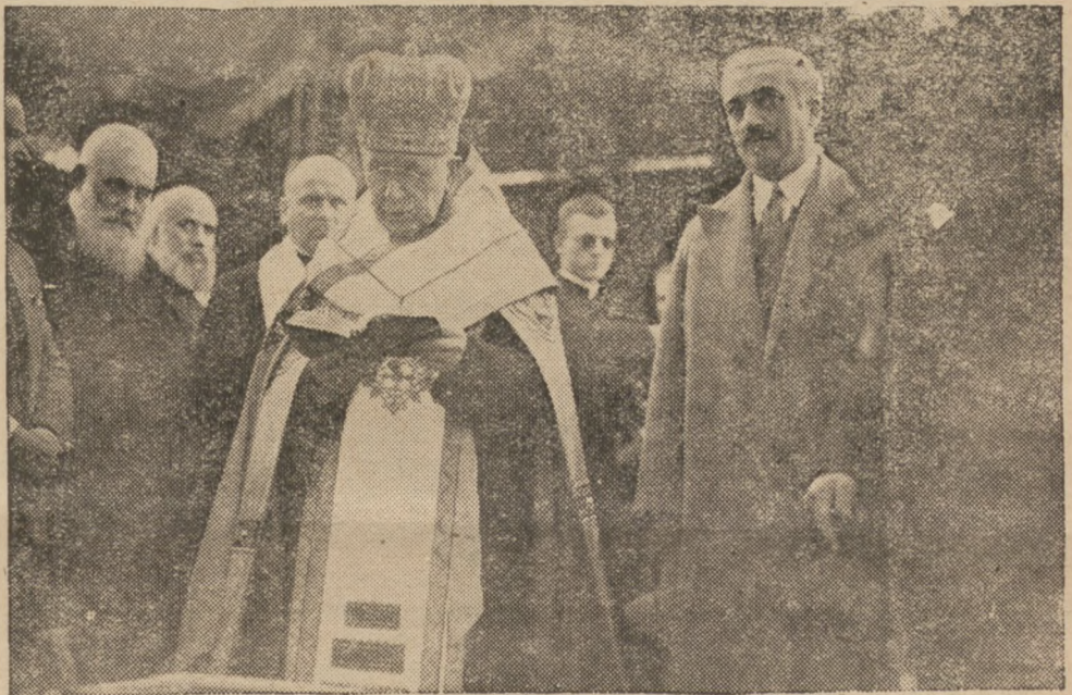
Преосв. Григорій Хомишин довершує чина посвячення угольного каменя під укр. Колегію св. Йосафата в Римі.

До многих радощів, якими Провидіння увінчало Його священничий Ювілей, причислює св. Отець факт, що конференція українських єпископів змогла відбутися так щасливо, з такою згодою й хісном, з такою Славою Божою, з таким добром для душ, — та другий факт, — що повелося дати, початок новій Семинарії й Колегії Йосафата — для дорогих Йому українських синів.