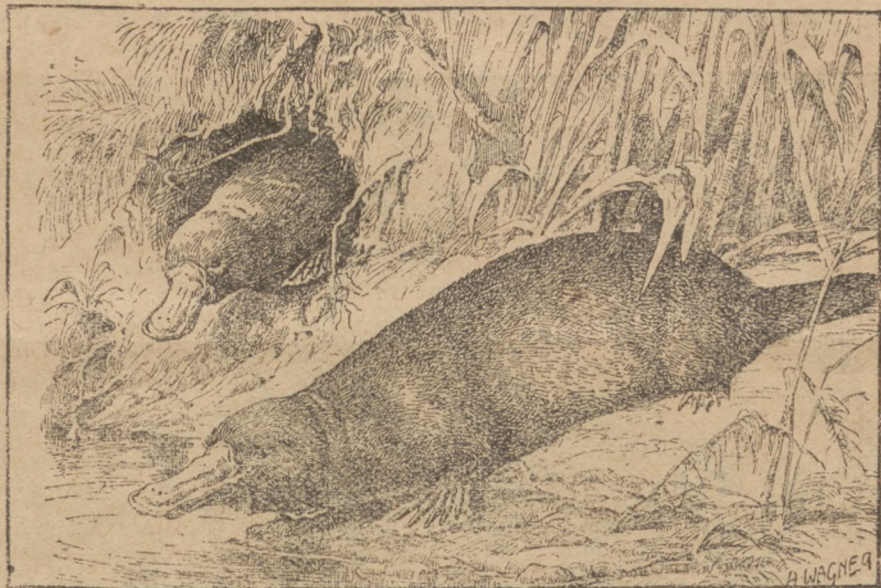
Ссавці, що зносять яйця.

В Австралії живе одинокий у світі рід ссавців, які зносять і висиджують яйця. Сі ссавці, се клювинці або як їх австралійські тубильці називають