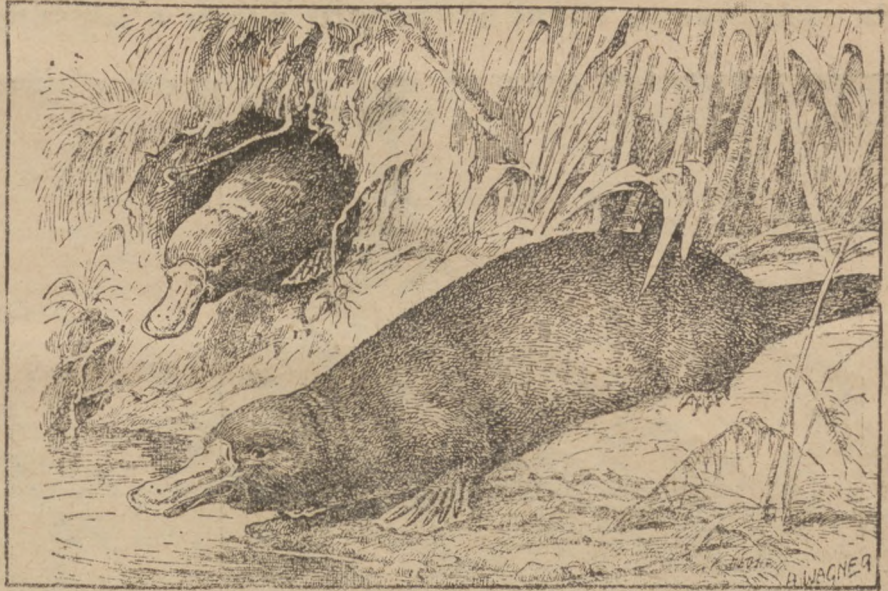
Ссавці, що зносять яйця.

В Австралії живе одинокий у світі рід ссавців, які зносять і висиджують яйця. Сі ссавці, се клювинці або як їх австралійські тубильці називають