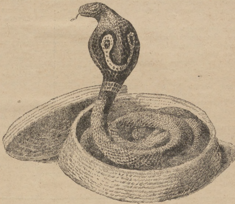
Гадина „очкар“ (індійська кобра) в кошику.

„І положу вражду між тобою і людиною“ — сказав Господь до вужа в раю. І справді, дивна, споконвічна ненависть панує між людиною і вужем. Люди бояться вужа якимсь забобоним ляком. В народних повірях вужі й гадюки є прообразом зла. Поганські народи бояться їх і почитають як божества.