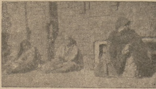
В „раю“: за прошенням хлібом.

каже наш сторож, старе ледащо й великий філософ. А індустріалізація в нас, справді неабияка. Щезло все — навіть мітли... В Н. ще в серпні хтось украв старий кухонний ніж, новий ніж він дістав на селі; поїхав туди й виміняв ніж у коваля за стару збірку (поезій) Якубовича-Мельшина: „Русская Муза“. В коваля була дочка, яка дуже любила вірши й вона просила батька виміняти ніж на книжку, що їй подобалася. З Петрогаду за ножиком треба їхати на село, от яку індустріалізацію ми осягнули“.