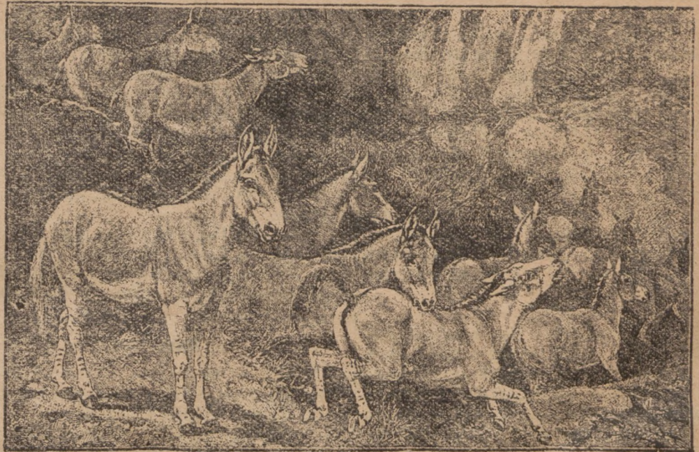
Табун джигетаїв на мандрівці.

Звірята, які живуть спільним життям, але лише меншими спілками, творять найчастіше більші громади, коли біда приневолює їх до мандрівки. Зправила буває то з браку поживи або води. Така мандрівка подібна на мандрівку на-родів у давню давнину. Мандрівки такі або неправильні, або — відповідно до пір року — бувають у відповідний час дуже правильні. Звірята ті все вертаються в протилежному напрямі до давніх своїх осель.