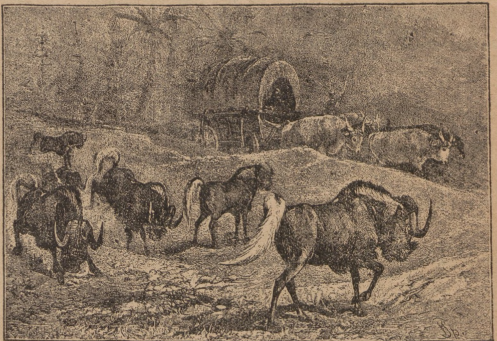
Громада гнусів на стрічі з возом кольоністів.

ни, що часом начислюють п'ятдесят штук, стоять під проводом жеребця (огира). Літом, хоч лише переходно, живуть більшими стадами і пасуться спільно. Що року, ще заки западе зима, правильно є на мандрівці. Тоді лучаться в тисячні стада, а як сніг зачне таяти, вертаються у свої літні області