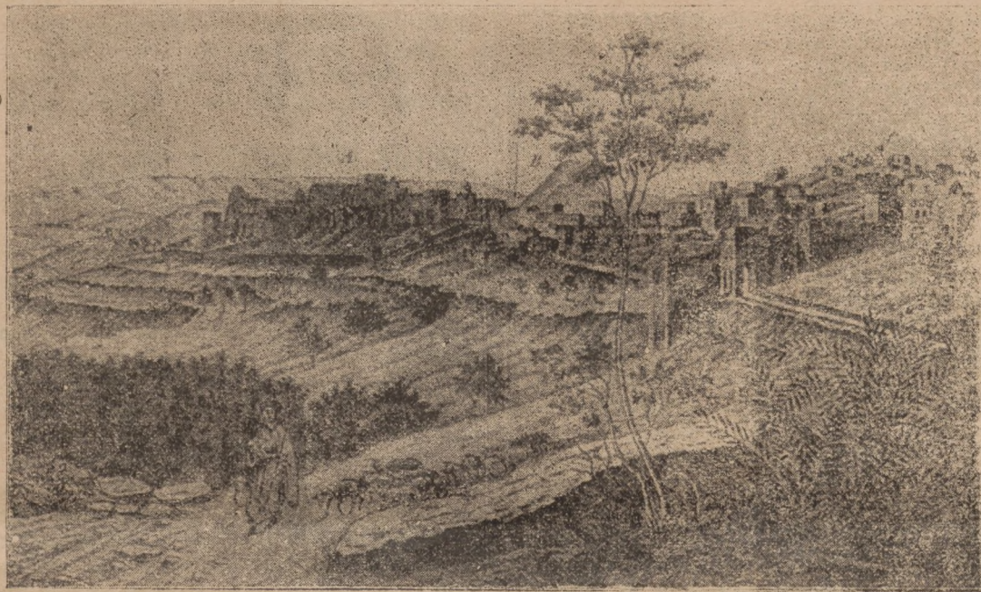
Вифлеєм. А. церква над вертепом де народився Христос. В. Гора Франків. С. місто Вифлеєм.

Різдво Христове! І наша думка лине далеко, далеко в святу землю, в місто, де прийшов на світ Спаситель — у Вифлеєм.