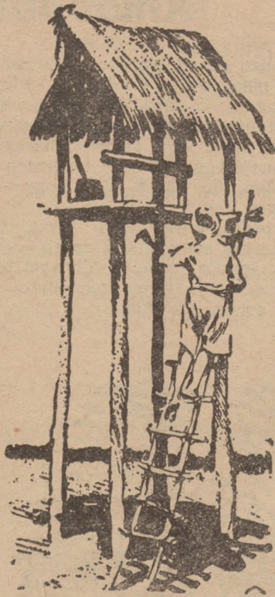
Вартівня полевого сторожа

Полеві сторожі виходять саме на вартові будки, що стоять на палях високих на три метри. Так із гори стежать вони за чотириногими та двоногими злодіями, щоб завчасу прогнати їх із поля, або приловити на горячому вчинку.