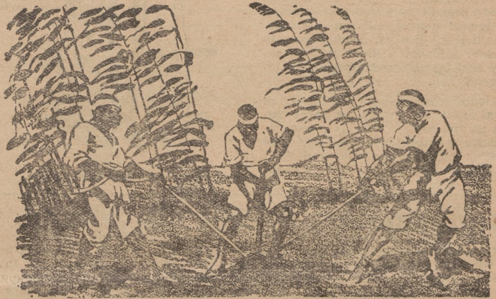
Корейці орють ручним плугом

Хліборобство ведуть тамешні селяне ще в дуже первісний, та в своєрідний спосіб. Корейський хлібороб ще й досі обробляє землю цими самими господарськими знарядями, що його предки в прадавних часах. Плуг, що його тягне звичайно один віл, ще зівсім такий, як уживали його в допотопні часи. Увесь він із дерева, тільки на кінці мале вістря з заліза. Ба що більше, вживають ще (як це бачимо на образку) й ручних плугів. Тут один чоловік втискає плуг у землю, а двох тягне мотуззям.