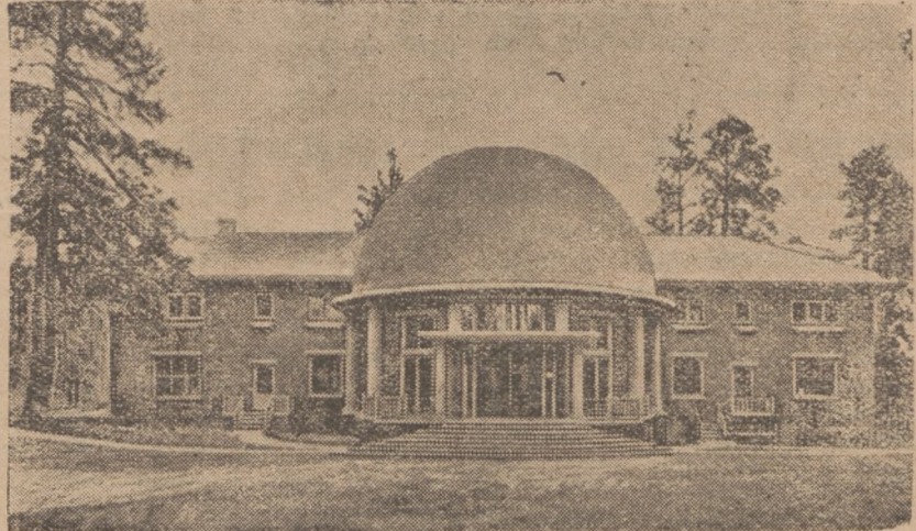
Астрономічна обсерваторія у Флягстофі

Астрономічна обсерваторія, (заведення, де стежать за ходом зір та досліджують їх) у Флягстоф, Арізона, подала до відома, що там відкрили нову дев'яту планету, що належить до системи нашого сонця.