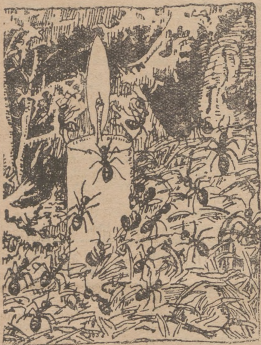
Мурашки гасять запалену свічку в протязі 4 1/2 мінути.

Такий цікавий примір, де мурашки, щоб ратувати свою державу, свій мурашник, жертвували життям, описує один дослідник природи.