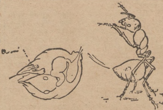
Мурашка витрискує їд із залози. побіч сама залоза.

Все це гашення свічки тривало пів пята хвилини. Та мурашки дальше звочували гніт і горяче чатиння. Інші збирали спалені жертви й ратували ранених. Навіть частину мурашок, що потонули в стеарині, вдалося їм витягнути заки ще стеарина застигла. По хвилині мурашки вспокійлися. Численні відділи вертали до своїх звичайних робіт. Остали