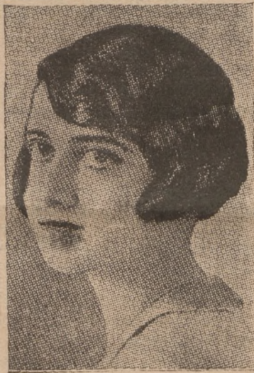
Кн. Софія, наймолодша дочка італійського короля, має заручитися з кн. Оттоном, кандидатом на угорський престіл.