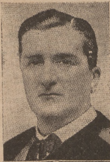
Адмірал Горті, теперішній регент Угорщини, який уступить по проголошенню Оттона угорським королем.

До війни жила Угорщина не тільки з країв, що належали до угорського королівства, а й із спільного австрійсько-угорського бюджету. По війні Угорщину сильно обокрили. Оставили їй тільки землі заселені Мадярами. Тож тяжко приходиться тепер громадянам Угорщини, а вже найважче угорським селянам.