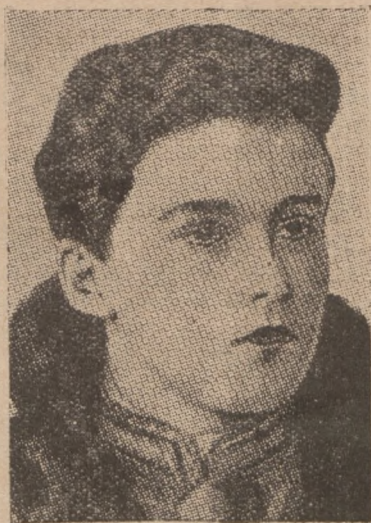
Князь Отто Габсбург, найстарший син бувшого австрійського цісаря Карла, має бути проголошений в осени королем Угорщини