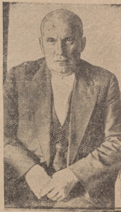
Провідник фінляндської селянської організації Лалпійців