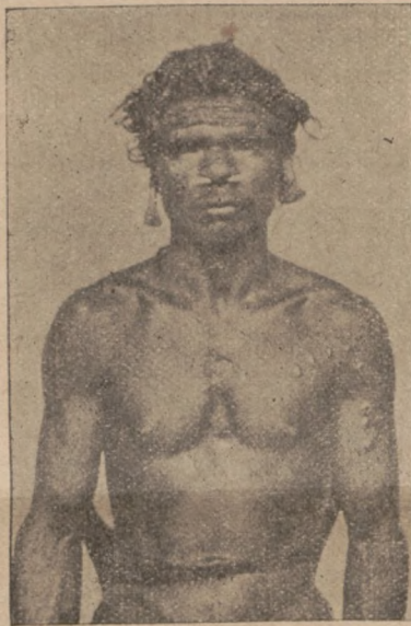
Тип Сакаїця-Сеноя, мешканця маляйського пралісу

Сакаї перш усього дуже люблять чепуритися, зовсім так як і культурні