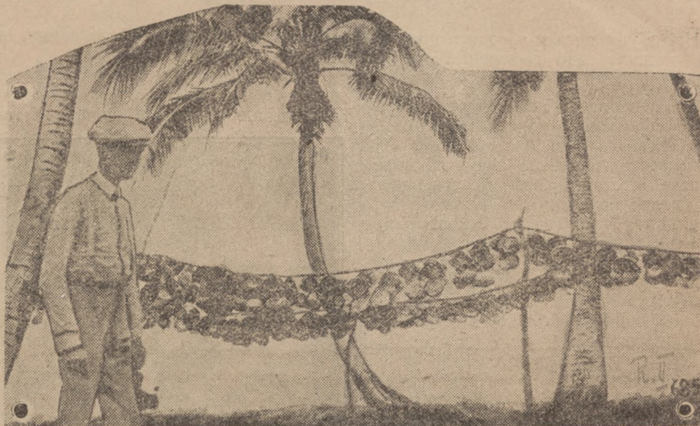
Сушать овочі кокосової пальми.

Мешканці острова Фіджі бачать усе своє багатство в кокосових пальмах. Кокосові горіхи це одинокі джерело їх прибутків. Та від 50 літ там неврожай на кокосові горіхи. А причиною неврожаю малий голубий метелик. Його гусениці кинулися на листя кокосових пальм і воно стало вянути, а дерева перестали родити. Знавці даремно шукали способу, як вигубити цього шкідни-