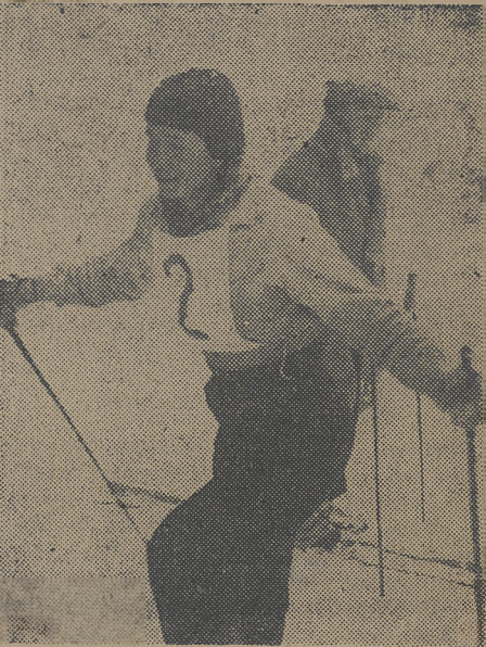
Znana narciarka polska Marusarzówna

Ruch turystyczny będzie silnie popierany, jednak trzeba jasno powiedzieć, że zależy on będzie w głównej mierze od zorganizowania terenu dla narciarstwa, jednak trzeba jasno powie-