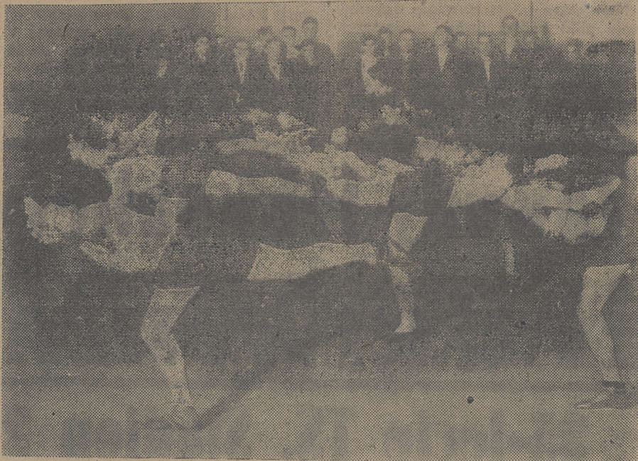
Ćwiczenia robotników w ZSRR.

biologiczne i kliniczne. Przemawiają za tym zarówno spostrzeżenia powsta- wiania pod wpływem wyczerpującej pracy fizycznej pewnych zmian psy- cho - patologicznych w postaci ner- wic, halucynacji, utraty pamięci itp. (badania Jotejki). Za przykład mogą