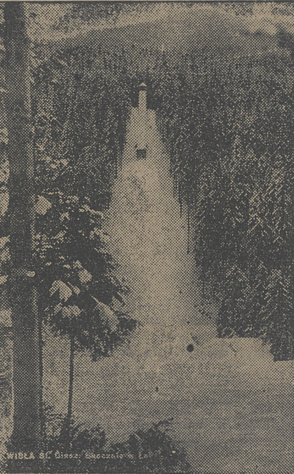
Skocznia w Wiśle