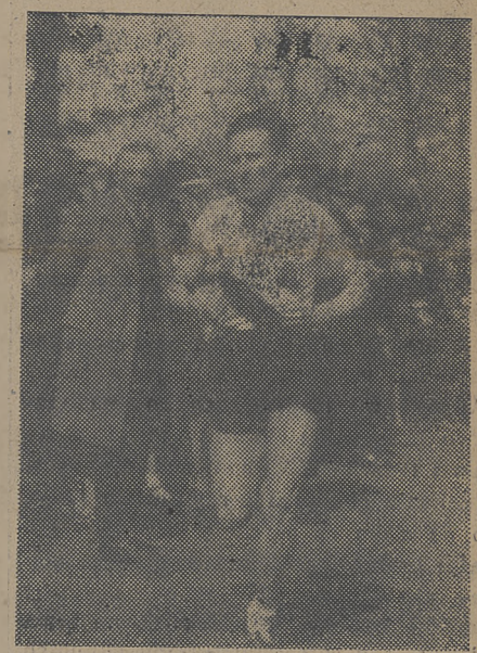
Najlepszy długodystansowiec Polski S. p. Kusociński Janusz

Organizacja zawodów szwankowała, zwłaszcza na odcinku informowania