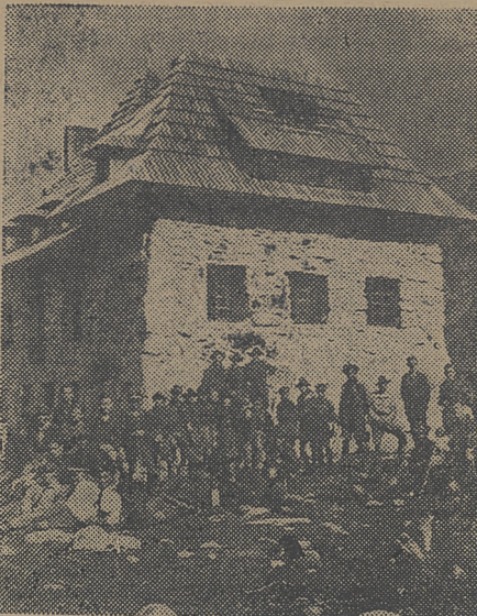
Schronisko na Hali Gąsienicowej

nej i stare schronisko TTN na Kalatówkach). Obecnie spłonęło, możliwe wskutek wypadku, schronisko PTT w Dolinie Pieciu Stawów. Również i w