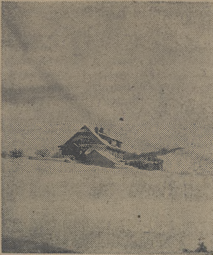
Schronisko na Czantorii w zimie

skoczni. Zabezpieczono również schronisko TTN na Kalatówkach, zajęte chwilowo jednak jeszcze przez władze wojskowe na kwatery.