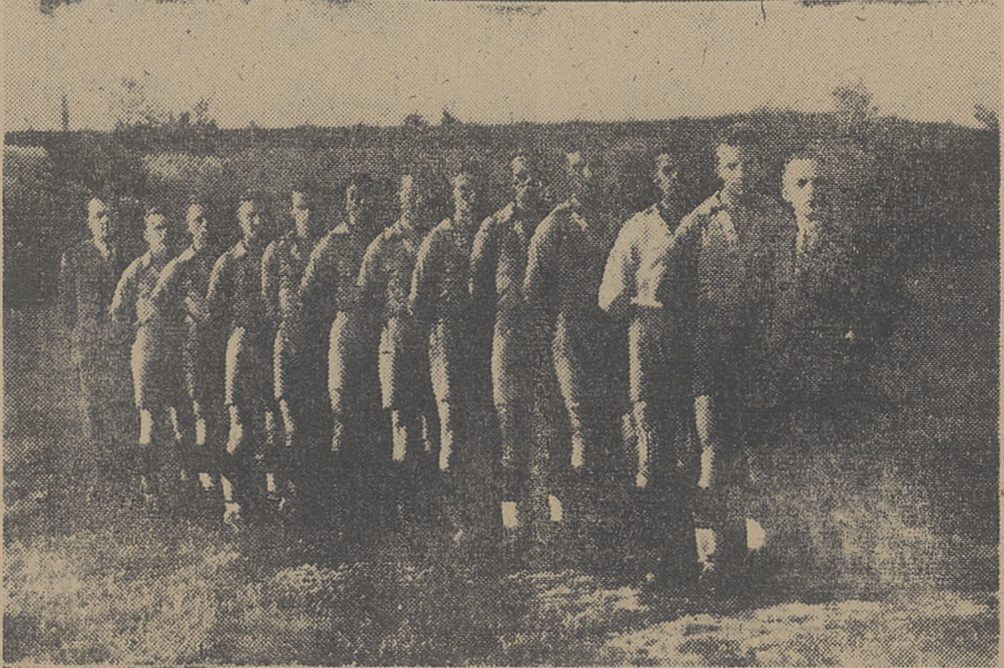
Piłkarze KS. Fablok Chrzanów

Próby meczów piłkarskich bądź to na własnym stadionie bądź też na łakach kończyły się zazwyczaj rozpadaniem graczy przez gestapo oraz niemiecką policję.