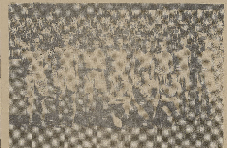
Drużyna piłkarska SK Morawska Ostrava która w ub. tygodniu w Bytomiu i Chorzowie remisując z Polonia Bytom 3:3 i przegrywając z AKS-em (Chorzów) 0:7

W składzie tym mogą jeszcze zająć ew. zmiany.