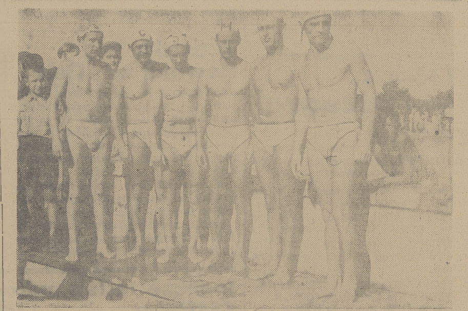
Drużyna piłki wodnej Cracovii najpoważniejszy kandydat na mistrza Polski w r. b.