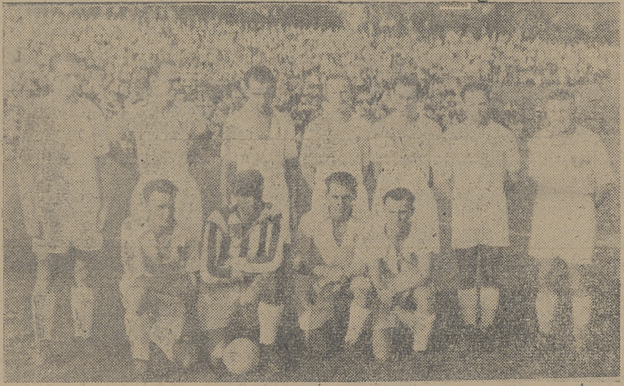
Komb. zespół Polonii (Bytom) i AKS (Chorzów), który ub. niedzieli zremisował z Bratisławą 3:3 w Bytomiu

Po tym sukcesie drużyna bułgarska opuściła już Związek Radziecki, udając się do kraju.