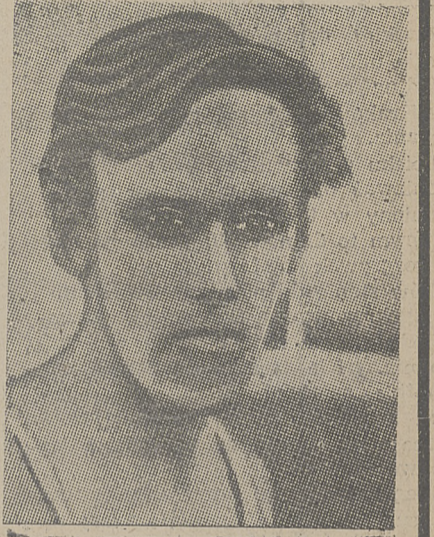
LINDENCRAINTZ (Szwecja) doskonały skoczek w zwyż