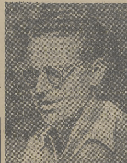
Jarosław Drobny — jeden z najlepszych tenisistów w Europie chwili obecnej

BELGIA BIJE HOLANDIĘ 7:72 Bruksela. Mecz lekkoatletyczny pomiędzy Belgią i Holandią zakończył się nieznaczącym zwycięstwem Belgii 7:72 pkt.