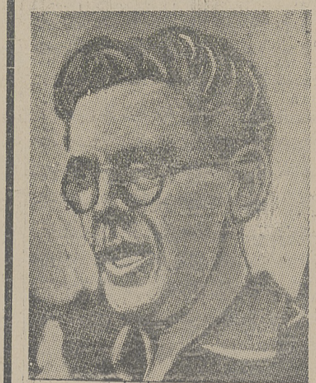
LINDMAN (Szwecja) najlepszy płotkarz świata