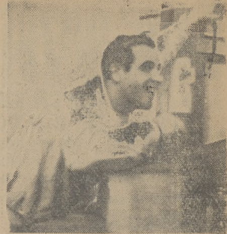
Sekundant Poznania denerwuje się...