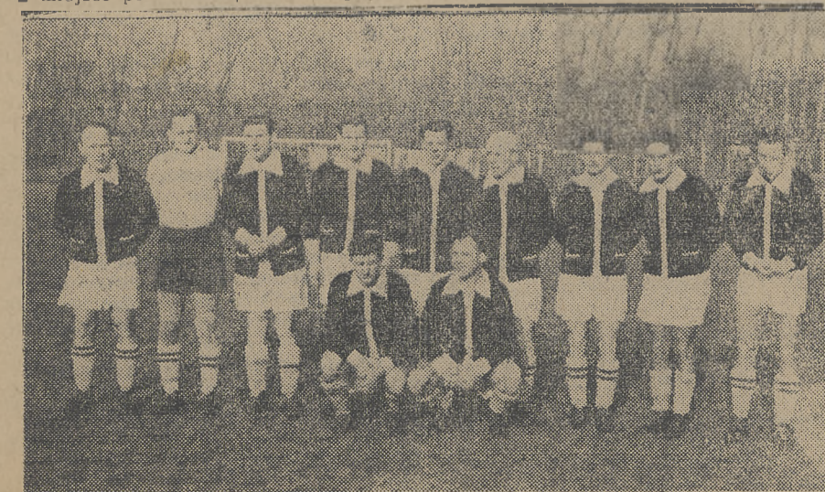
AKS który skończył rozgrywki o mistrzostwo Polski na 4-y miejscu

W walkach finałowych AKS zajął 2 miejsce po Cracovii, a w rok później