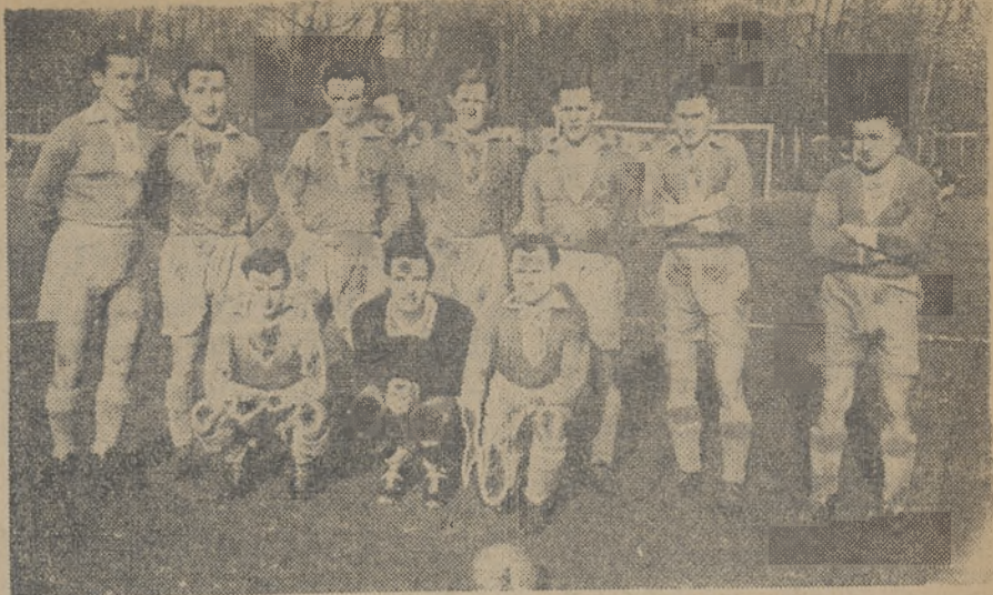
W tym składzie wystąpił AKS w niedzielę przeciwko Polonii.