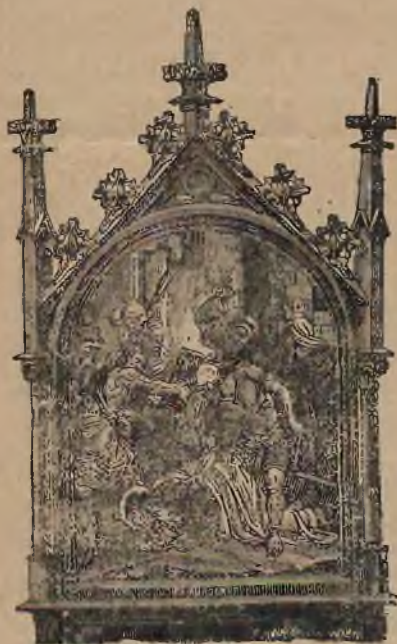
Rzeźbione w drzewie, w bogatej malaturze.