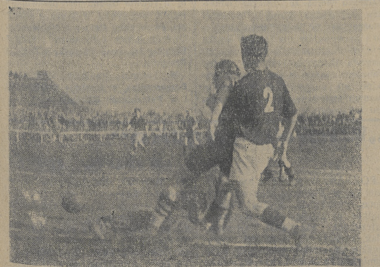
Fragment z meczu Górnik Szombierki — Lechia 3-0