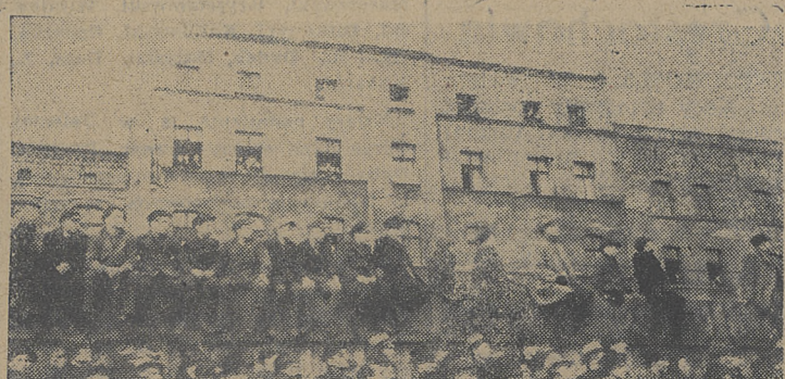
„Trybuny” Balidonu podczas meczu z Tarnovią

CRACOVIA JEDZIE DO RZESZOWA Na święta Wielkanocne Cracovia jedzie do Rzeszowa, gdzie rozegra dwa spotkania towarzyskie i stołeczną Gwardia.