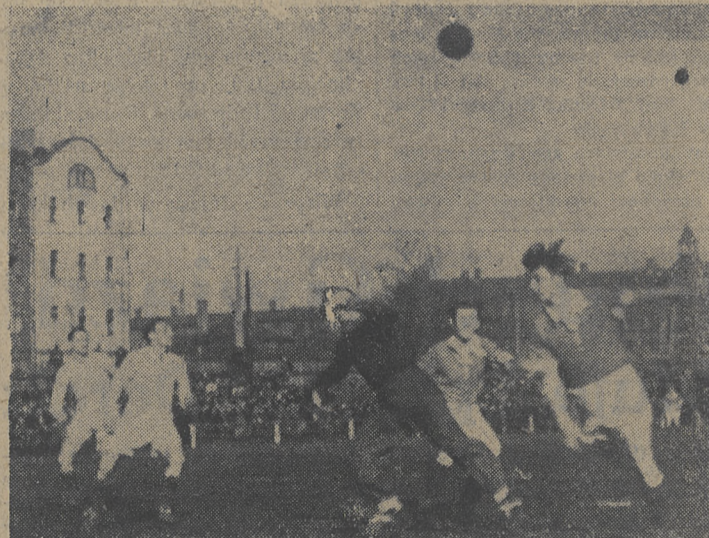
Niebezpieczny moment, Balidon atakuje, ale obrona Tarnovi jest na posterunku.