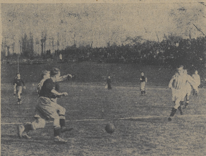
Cracovia atakuje. Z meczu Polonia B - Cracovia

...dze tow. Borkowicz da sygnał rozpoczęcia wyścigu. Kolarze ruszą do wielkiego boju, który odbywać się będzie w zupełnie innej atmosferze niż pamiętny wyścig Berlin - Warszawa zorganizowany przez rządy hitlerowskie i sanacyjne. Do walki ruszą kolarze przedstawiciele robotniczych związków zawodowych, ruszą ludzie, których nie będą dzielić różnice klasowe, różnice poglądów, czy przekonań. Zwycięży najlepsza, najlepiej przygotowana do wyścigu drużyna. Na całej trasie wyścigu trwają gorączkowe przygotowania. Tak na terenie Czechosłowacji jak i Polski organizatorzy dokładają wszelkich starań, by nadać wyścigowi należyty oprawę, by zamienić go w imponującą manifestację przyjaźni narodów milujących pokój.