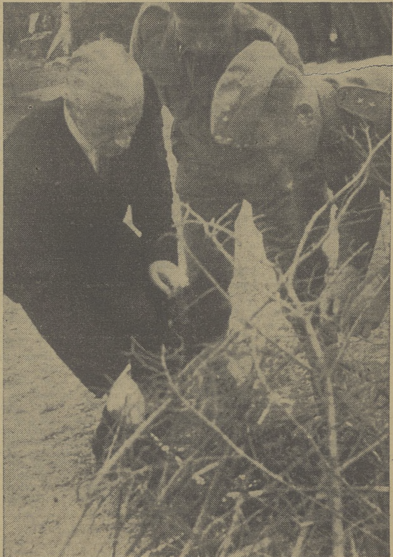
Pan Prezydent podpala ognisko żołnierskie