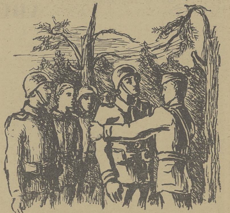
Oby Ojczyzna więcej takich miała! ...

pożarami miast i wsi polskich. Sytuacja stawała się co raz cięższa. Od zachodu napierały dywizje niemieckie, gęsto padały pociski. I znów wsiąkała krew polska w mech leśny i znów sosny przeżyły swe pokaleczone ramiona ku niebu prosząc Boga o pomstę.