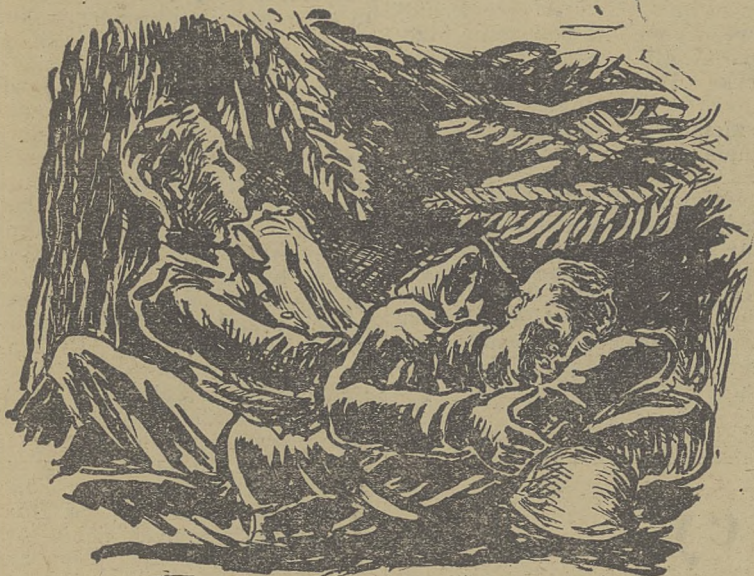
... pod zielonymi namiotami spata brat żołnierska