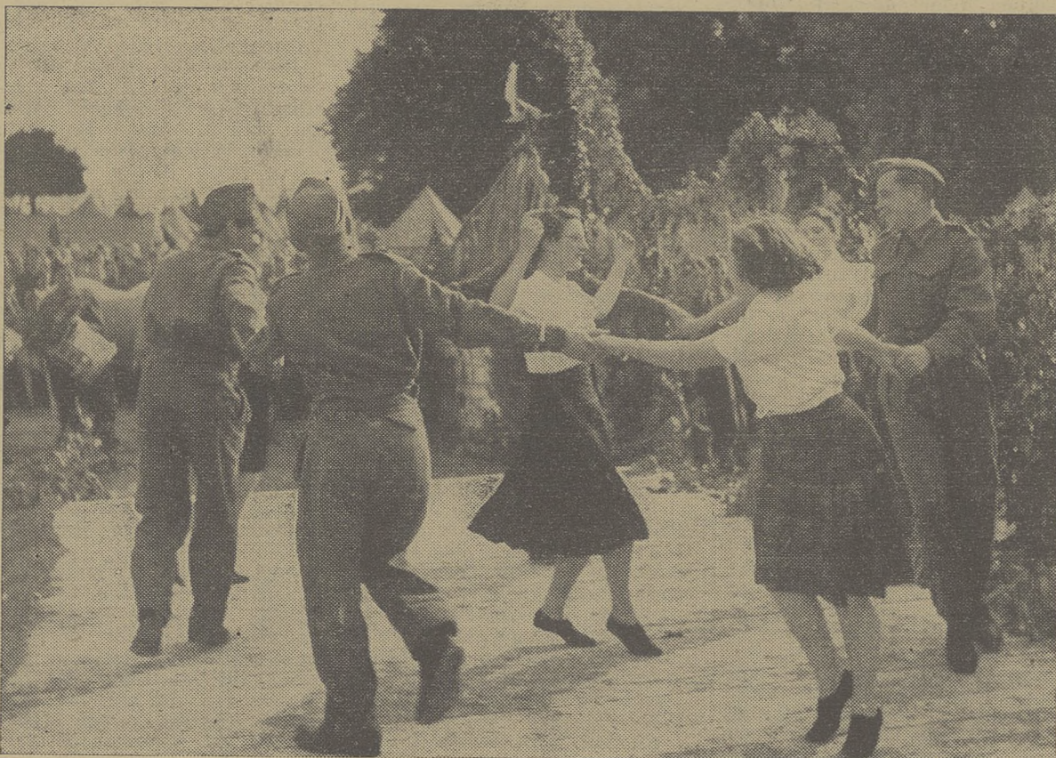
Nasze przyjaciółki Szkotki (zabawa obozowa w czasie Święta Żołnierza)