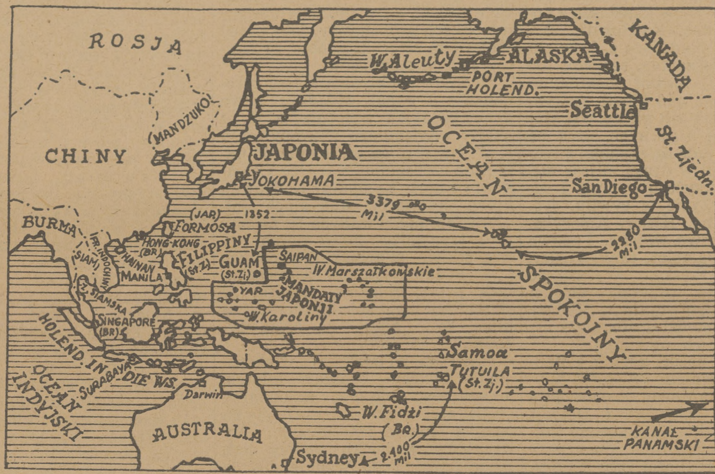
Mapa Dalekiego Wschodu pokazująca kluczowe położenie twierdzy Singapore

Sir Stamford Raffles, przyglądający się z wyżyn marmurowego piedestału na zakurzonej plaży 400 tysięcznemu miastu, które w roku 1819-ym było kawałkiem dżungli, może być dumny, iż dzieło jego życia Singapore tłumaczy się na inne języki "miasto lwa" nie tylko w przenośni, ale i dosłownie.