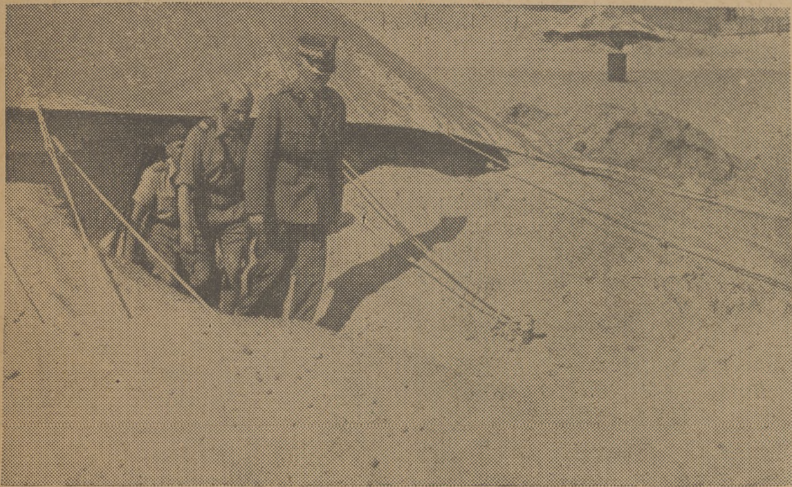
Gen. Sikorski po zwiedzeniu baraku-namiotu