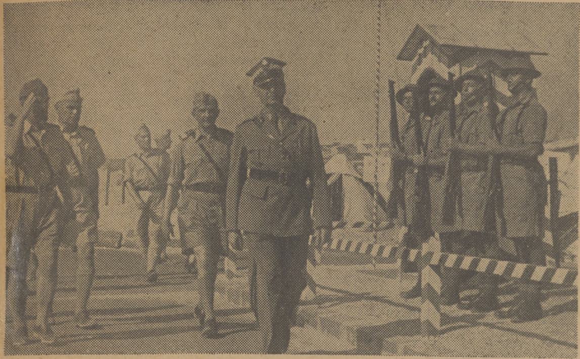
U wejścia na Oficerską Stację Zborną

(Korespondencja własna "Polski Walczącej")