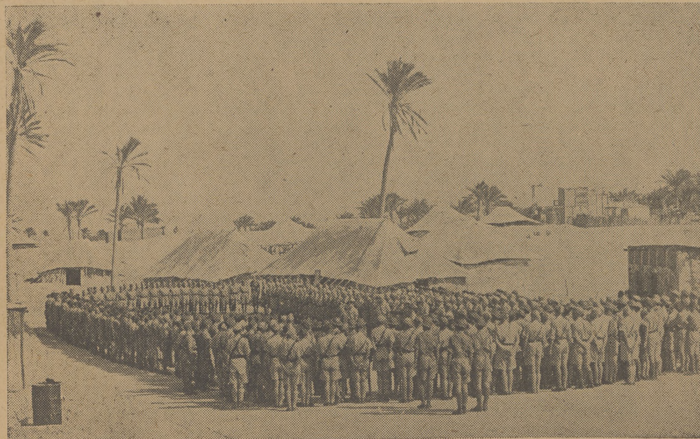
Słowa Naczelnego Wodza rozbrzmiewają pod afrykańskim niebem