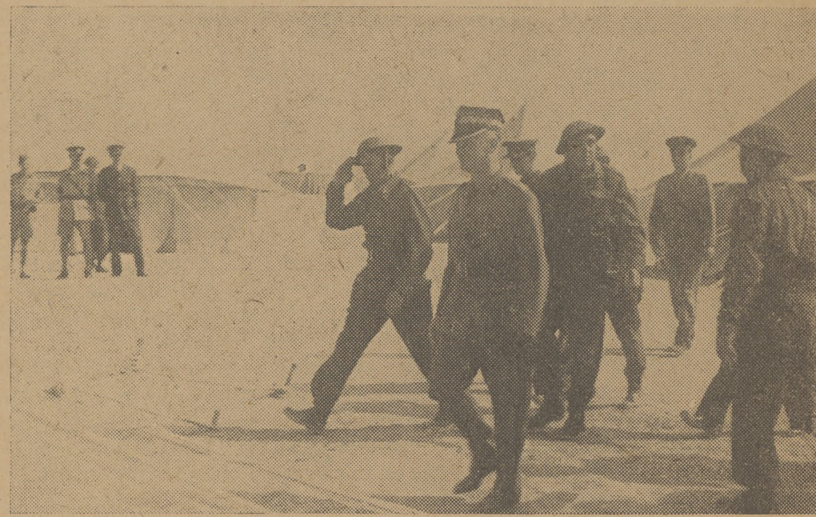
Gen. Sikorski w towarzystwie zastępy dowódcy Legii Oficerskiej

erów i foto- jskową prase, ską. Żeby rafi i złych staje nie tyl- przy której orzelka i ro- Ameryce zu- wodzenie, ale fotografii go- o dwa teksty