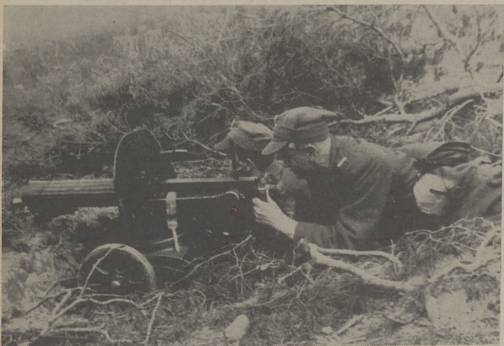
Na stanowisku ogniowym 77 Pułku