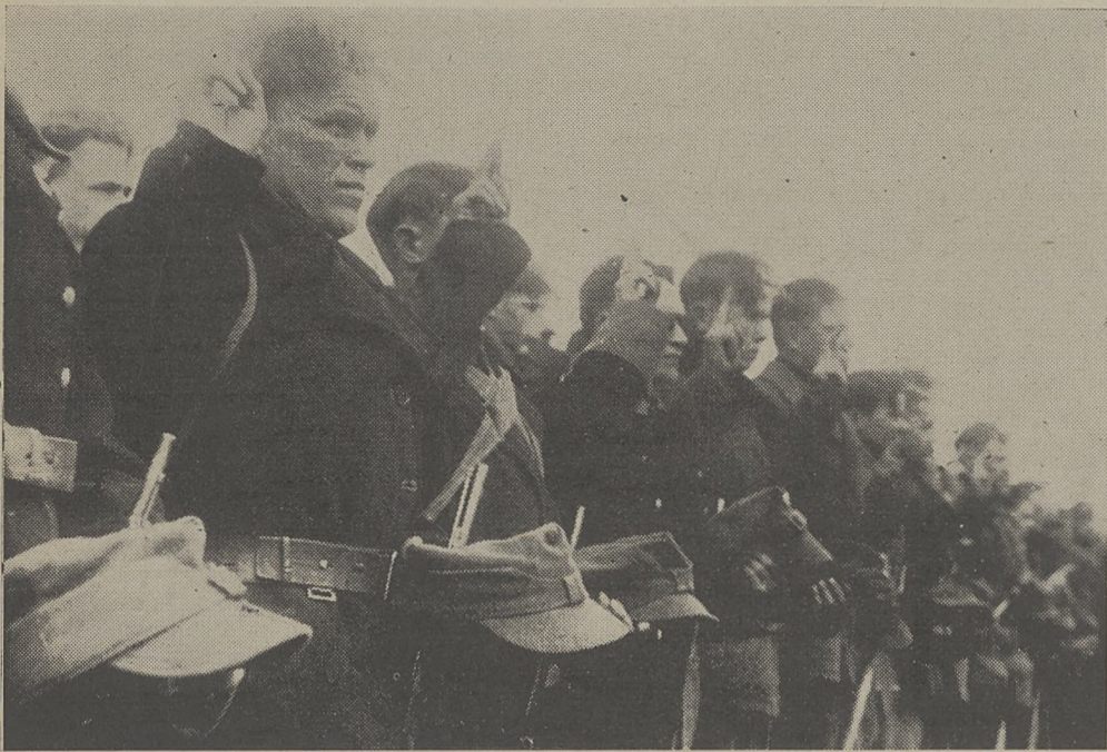
Przysięga żołnierzy 77 Pułku Piechoty