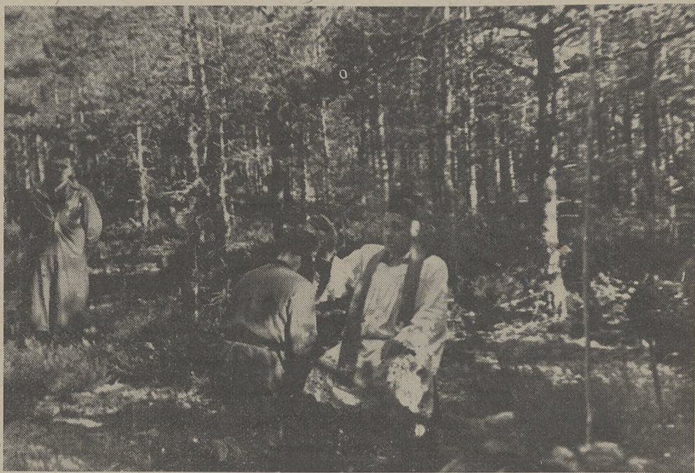
Spowiedź żołnierzy 9 Pułku Piechoty