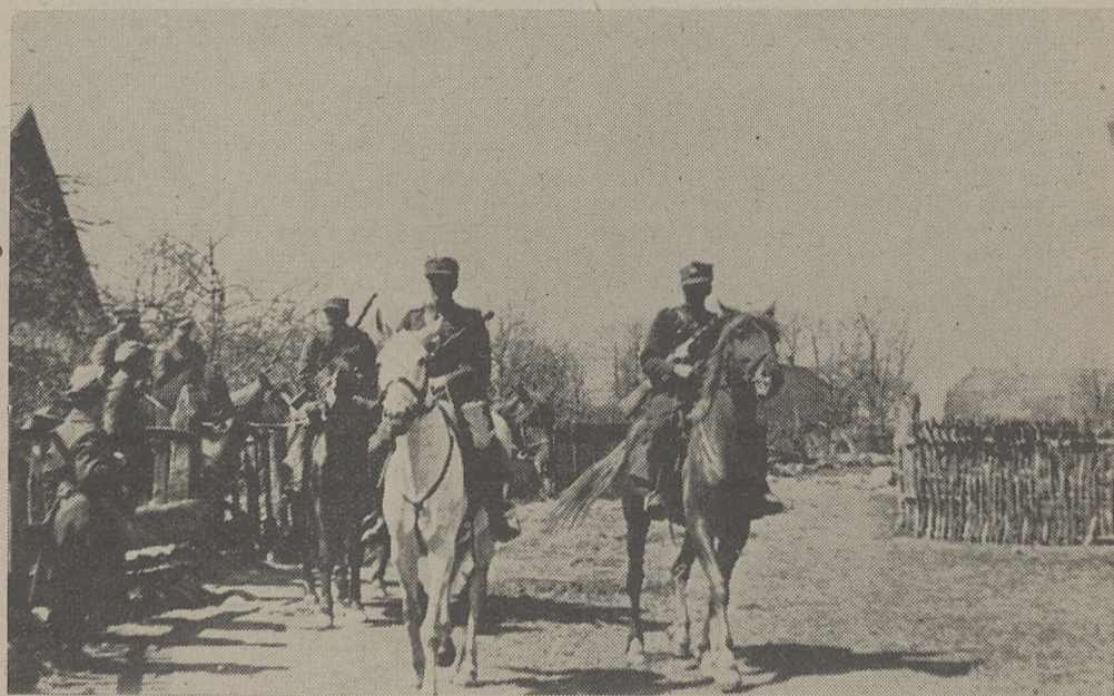
Rekonesans w okolicach Nowogródka