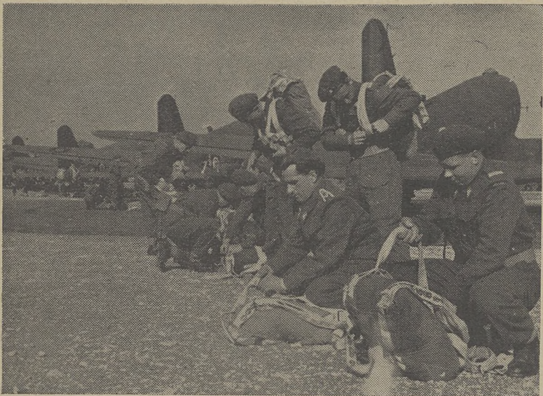
Przygotowania do odlotu