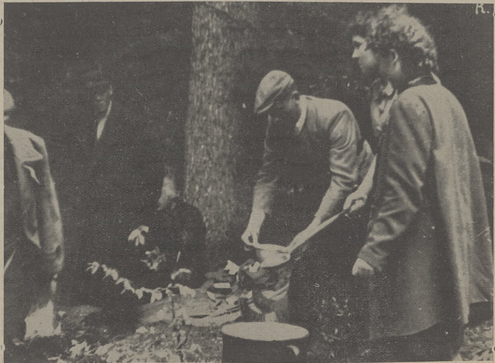
Posiłek w lesie — zdjęcie z maja 1944

Dwa d kiwanie z dworc nierzy, k się spod był ich z nich n sku, raz i własn oni! P dokładn Kanału, wych b cernej v lą Dyw drogę d znaczył kich dla własną, mi now na, a pr Falaise, we krw "Maczu sza Dy Niemoć i gdzie i dwie wściekl przeważ tego w względ Prag przybył czytać łem ty zmiane z tego niuje o do kog stward niedaw li i wid Pocza powiad O własn li nic, n woczes chodzi ozniszc El Alan dzialny w now o odroc Obaj Mówili siebie. pozosta gu, wię re szcz je tu n telegra jąco za urywar czynają w czasi