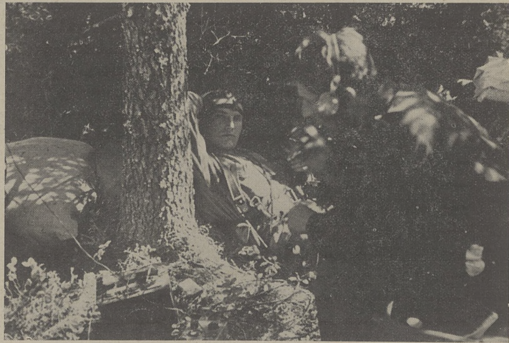
Obsługa radiowa przy pracy