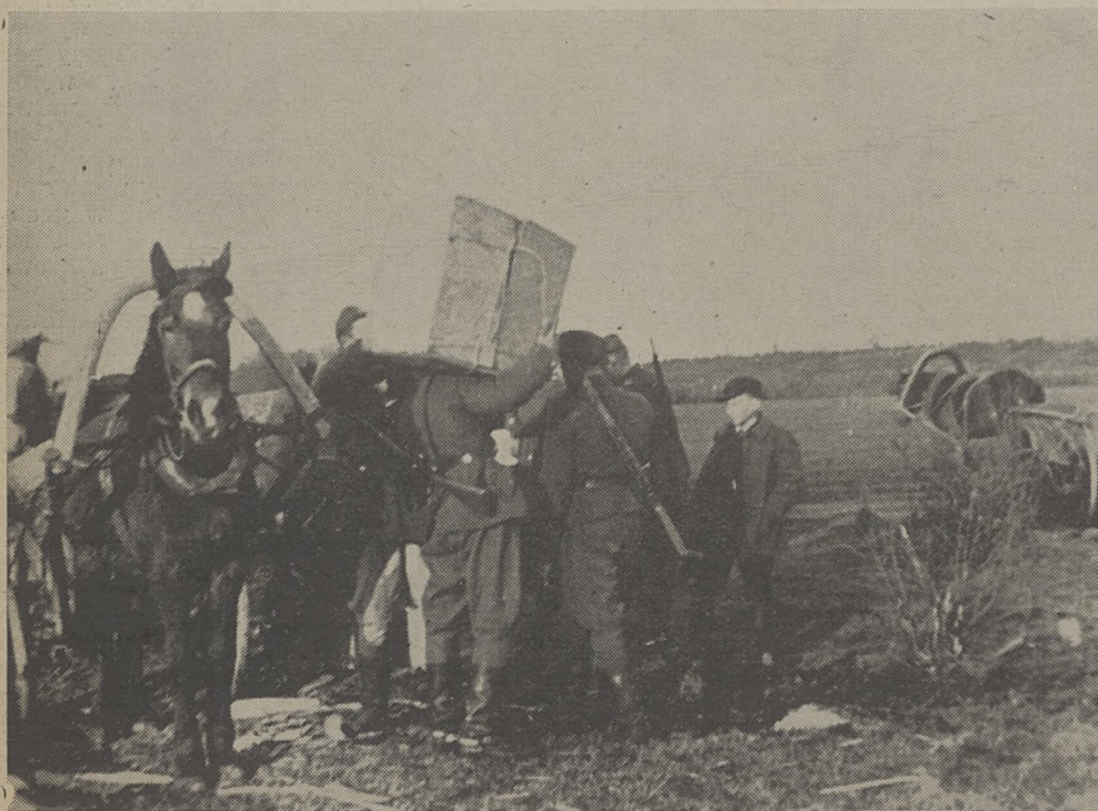
Zaopatrzenie dla Armii Krajowej