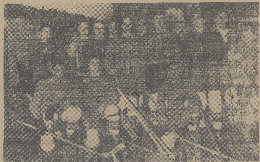
Reprezentacja hokejowa Włoch

Podczas okupacji niemieckiej pozostali we Francji jeszcze Kanadyjczycy wyjechali oczywiście a poziom hokeja francuskiego obniżył się bardzo wydatnie. W latach 1941 - 1945 najlepsza drużyna hokejowa Francji był EHC Chamonix który skład swój opierał na własnych starych graczach.