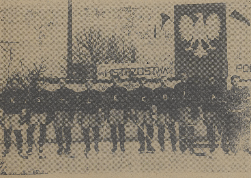
Mistrz hokejowy okr. poznańskiego KS Lechia

kończy rozgrywki rundy jesiennej W niedzielę i poniedziałek tylko 3 mecze mistrz.