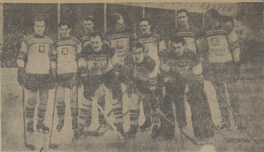
Repr. hokejowa Czechosłowacji

Jak się dowiadujemy, wyjazd hokeistów polskich do Budziejowic dojdzie na pewno do skutku.